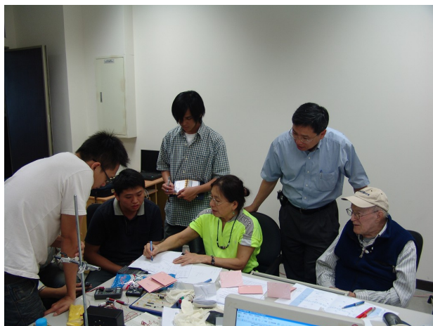
張萬珍 研發快訊編輯部